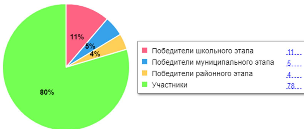
Диаграмма по результатам участия школьников во ВсОШ

В 2022 году был проанализирован объем участников конкурсных мероприятий разных уровней. Дистанционные формы работы с учащимися, создание условий для проявления их познавательной активности позволили принимать активное участие в дистанционных конкурсах регионального, всероссийского и международного уровней. Результат – положительная динамика участия в олимпиадах и конкурсах, привлечение к участию в интеллектуальных соревнованиях большего количества обучающихся Школы.