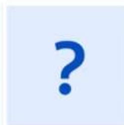
Пока не знаю