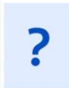
Пока не знаю